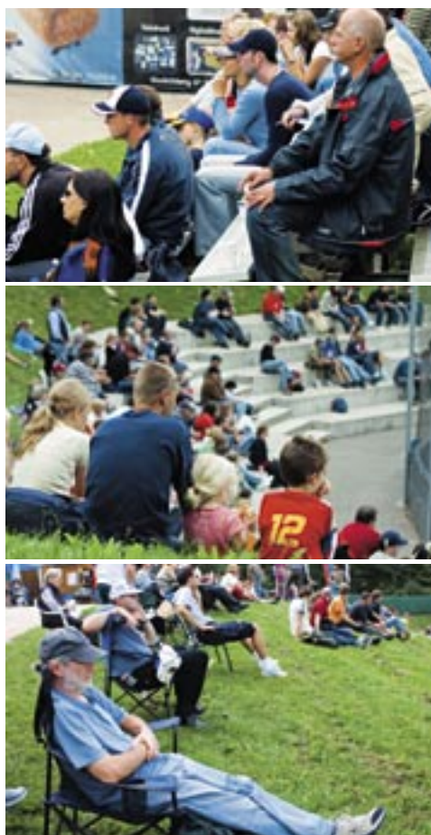
Der mitgebrachte Klappstuhl hat im Ballpark Konjunktur. Oder man sitzt mit der ganzen Familie einfach im Gras und auf den Stufen hinter der Home Plate.

Allerdings: Wie die imposante Schlagkeule beim Baseball nun wirklich heißt, das blieb dem Autor dieses Berichts bis heute verborgen. Vielleicht „Bat“ oder auf gut schwäbisch einfach „Bädschr“? kr