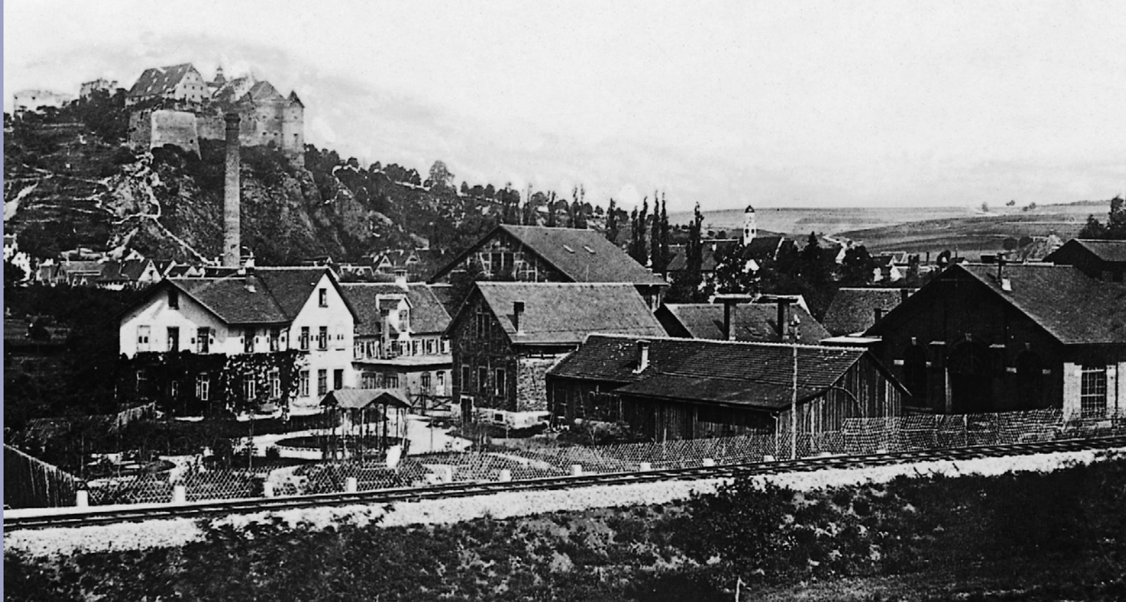
Voith in Heidenheim im 19. Jahrhundert.