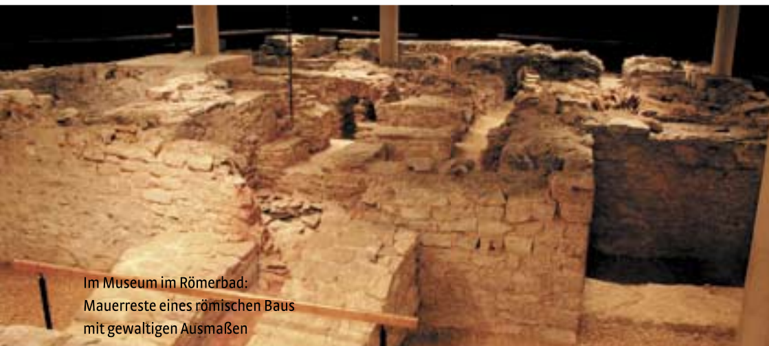
Im Museum im Römerbad: Mauerreste eines römischen Baus mit gewaltigen Ausmaßen