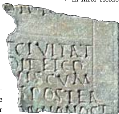
Bedeutender Fund 2004 aus dem Gutshof Fürsamen: Das Militärdiplom verlieh dreifache Rechte.

Ausgestellt sind auch schöne Funde aus dem römischen Gräberfeld am Südhang des Totenbergs, wo die Straße nach Faimingen vorbeiführte: ein Weihstein für Merkur, den Schutzgott der Kaufleute, ein Grabstein für einen wohlhabenden Bürger gallischer Herkunft oder eine Terra-Nigra-Schüssel, die gemäß der eingeritzten Inschrift von einem gewissen Amaranthus nach einem überlebten Schiffsunfall der in Sizilien verehrten Göttin Erycina gewidmet worden war. Hochwertiges Geschirr aus Terra-Sigillata-Keramik unter den Grabbeigaben gibt