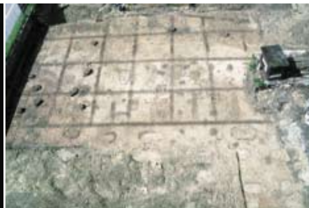
Grundriss einer römischen Kastellbaracke unter den jetzigen Schloss-Arkaden

Auch ein kleines Fundstück bringt manchmal einen großen wissenschaftlichen Fortschritt. Es ist vielleicht gerade das Binde-