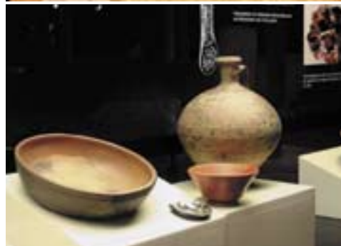
Exponate des Museums im Römerbad: