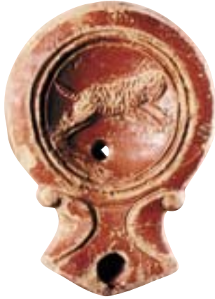
Einer der wichtigsten Funde in Heidenheim: ein mit einem Tiger geschmücktes Öllämpchen

glied, das zu einer eindeutigen Aussage fehlt. Die Funde in den letzten Jahren waren recht ergiebig: Waffen römischer Soldaten, Zierbeschläge von Pferdegeschirren mit farbigen Glas-Email-Einlagen, Schmuck, Münzen, Schlüsselringe, Fibeln, Spiegel, Hornschnitzereien, Öllämpchen, Scherben von Geschirr, zum Teil mit den Namenszügen der Soldaten – auch Pferdeskelette haben wir ausgegraben.