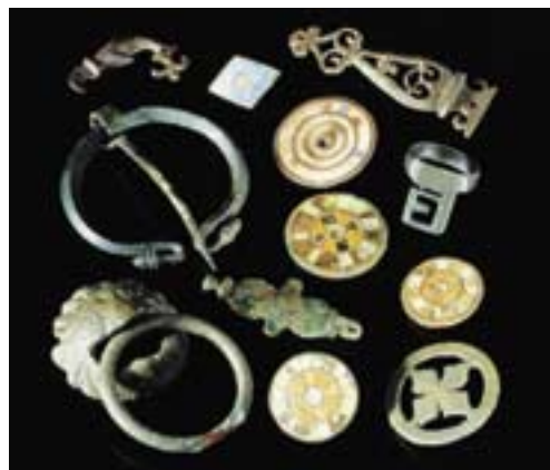
Nützliches und Schmückendes aus der römischen Antike: Funde an der „Gleisharfe“

Sind solche Grabungen selbstverständlich? Wer veranlasst sie?