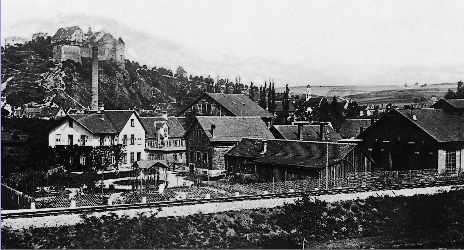
Voith in Heidenheim im 19. Jahrhundert.