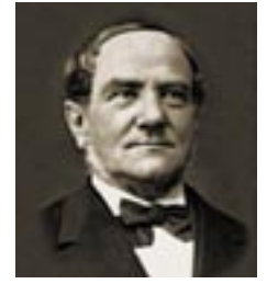
Victor von Bruns