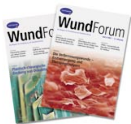
Anerkannt im medizinischen Blätterwald: das HARTMANN WundForum.

Das HARTMANN WundForum, in dessen hochkarätig besetztem Expertenbeirat auch