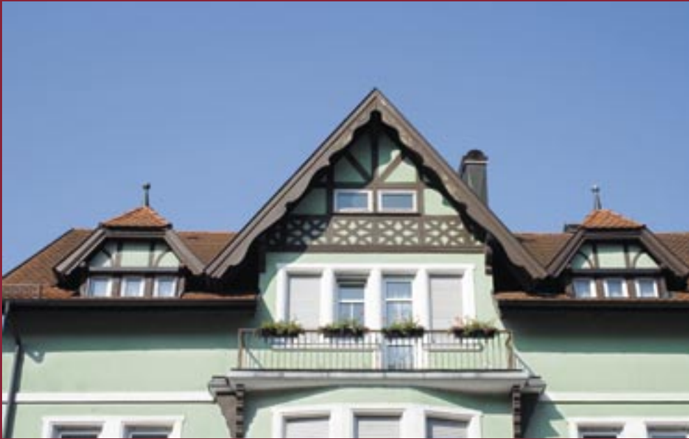
← Direkt gegenüber dem Konzerthaus: unten solide Sachlichkeit – im Dachgeschoss ein bisschen Schwarzwald-Romantik.