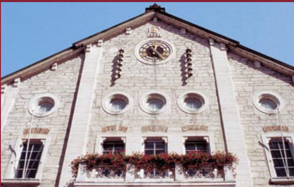
← Ehrwürdig und repräsentativ: das alte Heidenheimer Rathaus (heute Elmar-Doch-Haus) in der Hauptstraße.