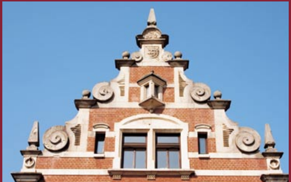
→ Besonders fantasievoll und mit zahlreichen Jugendstil-Anleihen hat sich der Bauherr dieses Hauses in der Schnaitheimer Straße verewigt.