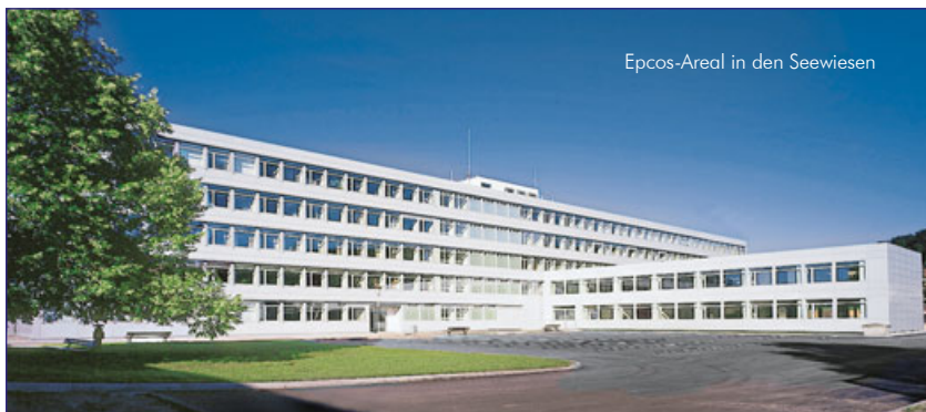
Epcos-Areal in den Seewiesen

Aktuell sind Räume von 30 bis 200 qm in günstiger Lage zu vermieten.